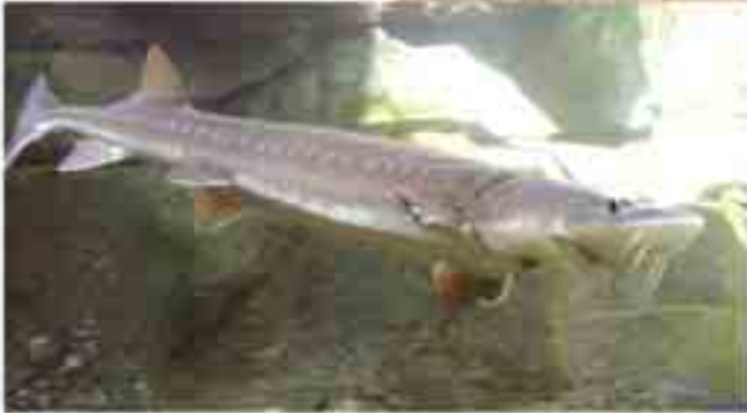
Mersin Balığı Dönem: Mezozoik zaman, JKretase dönemi Yaş: 144 - 65 milyon yıl Bölge: Çin