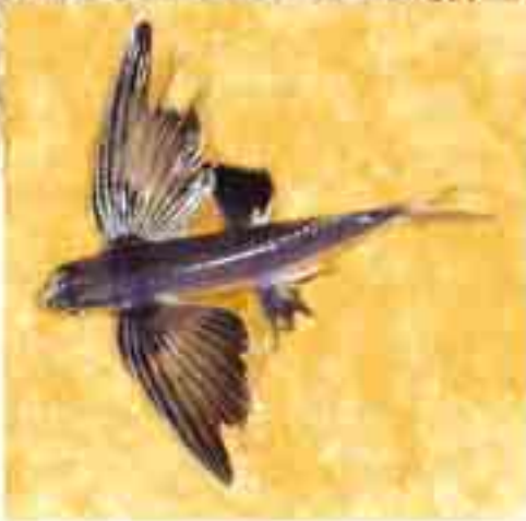
Uçan Balık Dönem: Mezozoik zaman, Kretase dönemi Yaş: 95 milyon yıl Bölge: Lübnan