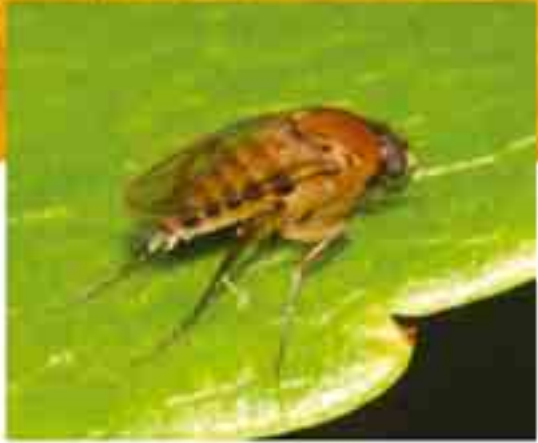
Kambur Sinek Dönem: Senozoik zaman, Eosen dönemi Yaş: 45 milyon yıl Bölge: Rusya