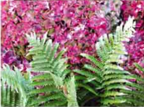
Eğrelti Otu Dönem: Paleozoik zaman, Karbonifer dönemi Yaş: 300 milyon yıl Bölge: İngiltere