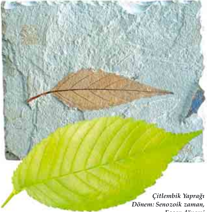
Çitlembik Yaprığı Dönem: Senozoik zaman, Eosen dönemi Yaş: 45 milyon yıl Bölge: Green River Oluşumu, Wyoming, ABD

Orta büyüklükte bir ağaç olan çitlembikler ortalama 10-25 metre uzunluğundadırlar. Bulunan tüm çitlembik fosilleri, bu bitkinin günümüzdeki örnekleriyle bundan on milyonlarca yıl önce yaşamış örneklerinin tamamen birbirinin aynı olduğunu ortaya koymaktadır. Bu aynılık, evrim iddiasını yerle bir etmektedir.