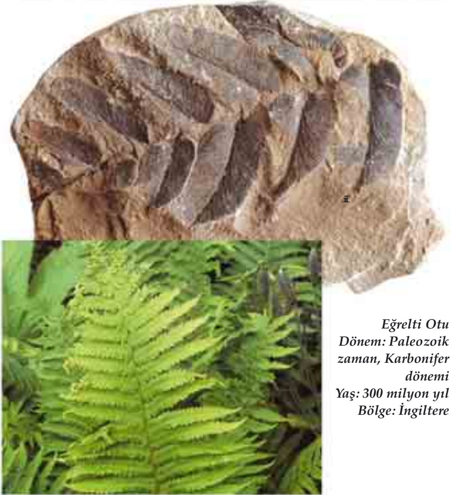
Eęreli Otu Dönem: Paleozoik zaman, Karbonifer dönemi Yaş: 300 milyon yıl Bölge: İngiltere